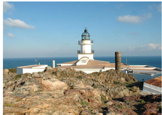
Far de Begur