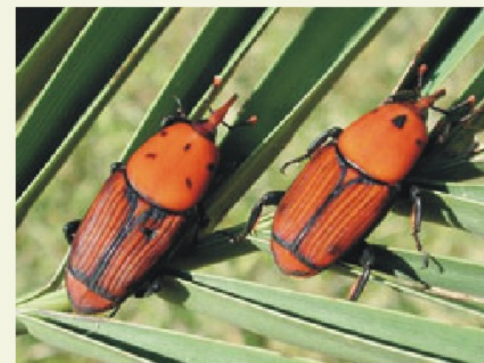
Rhynchophorus ferrugineus (Olivier, 1790)